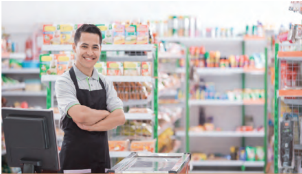
➤ ឥណទានអាជីវកម្ម

ផលិតផលឥណទានអាជីវកម្ម ត្រូវបានបង្កើតឡើងសម្រាប់អតិថិជនជារូបវន្តបុគ្គលដែលមានបំណងប្រើប្រាស់សម្រាប់ការចាប់ផ្តើមអាជីវកម្មការពង្រីកអាជីវកម្មដែលការប្រើប្រាស់នេះសមស្របទៅតាមបេសកកម្មរបស់គ្រឹះស្ថានយើងក្នុងការបង្កើនប្រាក់ចំណូល និងជីវភាពប្រជាជន។