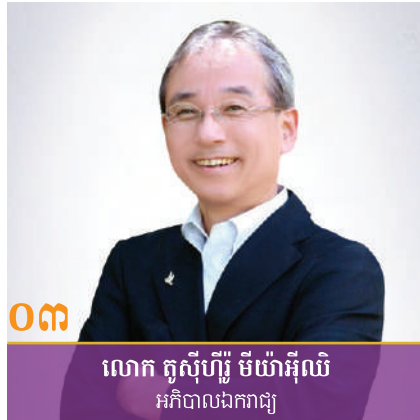
លោក តាកាហ៊ីរូ យ៉ាម៉ាស៊ីតា អភិបាល និងប្រធាននាយកហិរញ្ញវត្ថុ