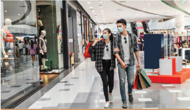
➤ ឥណទានផ្ទាល់ខ្លួន

ផលិតផលឥណទានផ្ទាល់ខ្លួនត្រូវបានបង្កើតឡើងដើម្បីបំពេញតម្រូវការរបស់អតិថិជនដែលមានបំណងប្រើប្រាស់សាច់ប្រាក់សម្រាប់ផ្គត់ផ្គង់គ្រួសារ និងសម្រាប់គោលបំណងផ្ទាល់ខ្លួនជាក់លាក់។ ឥណទានប្រភេទនេះបង្កភាពងាយស្រួលដល់អតិថិជនជាទីបំផុត ដោយសារតែវាមានភាពរហ័ស និងរយៈពេលវែងដែលអតិថិជនអាចសងត្រលប់មកវិញដោយប្រសិទ្ធភាព។