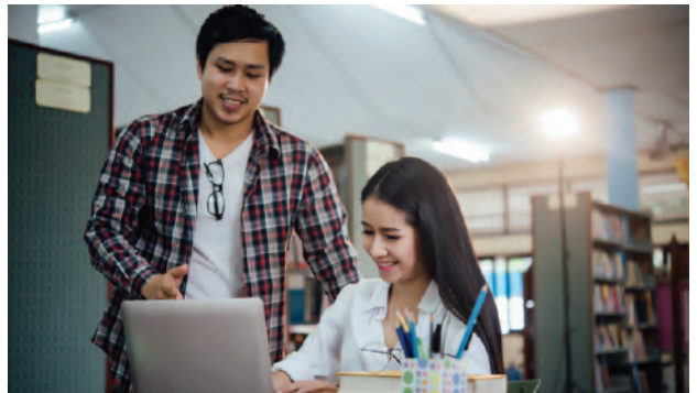
➤ ឥណទានការសិក្សា

ផលិតផលឥណទានគេហដ្ឋានត្រូវបានបង្កើតឡើងសម្រាប់អតិថិជនជារូបវន្តបុគ្គលដែលមានបំណងប្រើប្រាស់ក្នុងការទិញគេហដ្ឋានដោយមិនកំណត់លក្ខខណ្ឌ ។ អតិថិជនអាចយកទ្រព្យដែលទិញស្រាប់ ឬ ទ្រព្យផ្សេងជំនួសដើម្បីធ្វើជាទ្រព្យបញ្ចាំសម្រាប់ឥណទានប្រភេទនេះ។