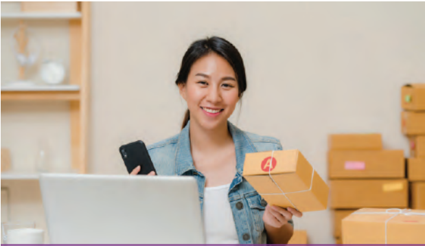
➤ សហគ្រាសខ្នាតតូច

សហគ្រាសខ្នាតតូចបំផុតដែលភាគច្រើនជាអាជីវកម្មលក្ខណៈគ្រួសារដែលមានសមាជិកគ្រួសារជាអ្នកជួយក្នុងសកម្មភាពអាជីវកម្ម។ សហគ្រាសទាំងនោះភាគច្រើនមានបុគ្គលិកតិចជាង ១០ នាក់ ដែលភាគច្រើនជាសមាជិកក្រុមគ្រួសារ។ សហគ្រាស ប្រភេទនេះសំបូរវិបល្លាសនៅតាមបណ្តាខេត្តក្នុងព្រះរាជាណាចក្រកម្ពុជា។