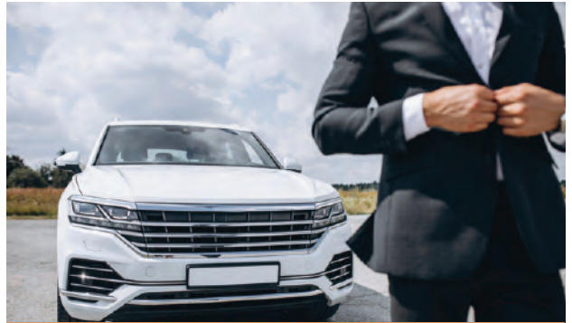
➤ ឥណទានរថយន្ត

ផលិតផលឥណទានអាជីវកម្ម ត្រូវបានបង្កើតឡើងសម្រាប់អតិថិជនជារូបវន្តបុគ្គលដែលមានបំណងប្រើប្រាស់សម្រាប់ការចាប់ផ្តើមអាជីវកម្មការពង្រីកអាជីវកម្មដែលការប្រើប្រាស់នេះសមស្របទៅតាមបេសកកម្មរបស់គ្រឹះស្ថានយើងក្នុងការបង្កើនប្រាក់ចំណូល និងជីវភាពប្រជាជន។