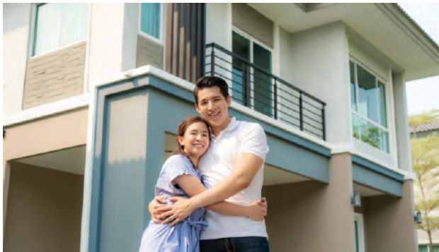
➤ ឥណទានគេហដ្ឋាន

ផលិតផលឥណទានរថយន្ត គឺបង្កើតឡើងដើម្បីបំពេញតម្រូវការរបស់អតិថិជនដែលមានតម្រូវការប្រើប្រាស់រថយន្តផ្ទាល់ខ្លួន ឬសម្រាប់គ្រួសារ ដែលគាត់អាចស្នើប្រើប្រាស់ឥណទានប្រភេទនេះបានយ៉ាងងាយស្រួលនិងរហ័សទាន់ចិត្ត។